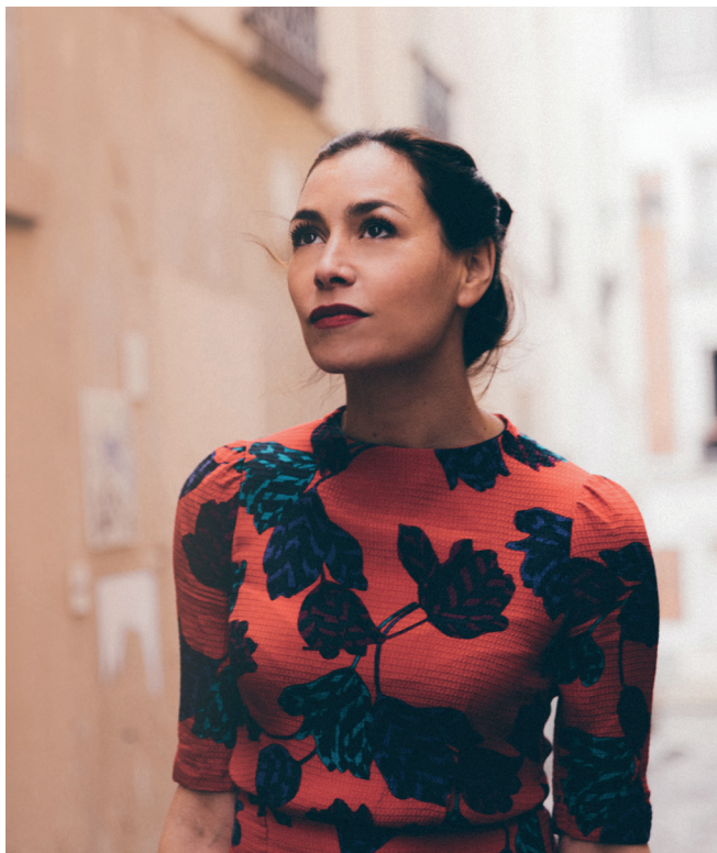
Olivia Ruiz