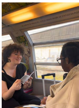
Le Serveur vocal poétique à bord du TGV Paris-Lille